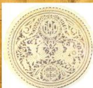
Шемогодская прорезная береста