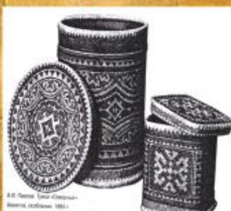
Изделия мастеров Якутии и Томской области